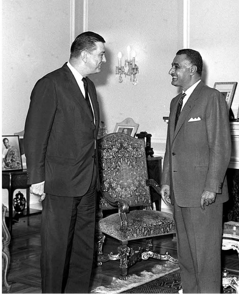
عبد الناصر يستقبل نائب وزير التجارة الأمريكى ١٩٦٣/٩/٢٨